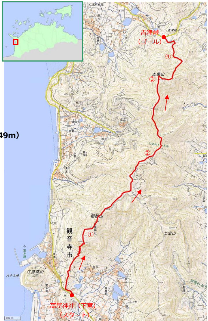
[地理院地図 (電子国土 Web) を加工して作成]