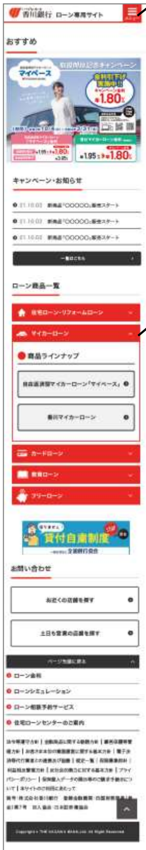
スマホ（トップページ）